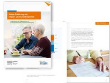
Broschüre „Meine Erklärung zur Organ- und Gewebespende“ Bestellnummer 60130004