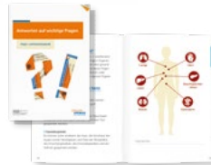
Broschüre „Antworten auf wichtige Fragen“ Bestellnummer: 60190100